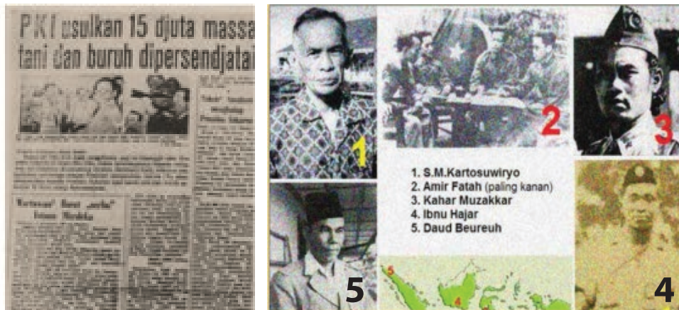
Gambar dikutip dari berbagai sumber